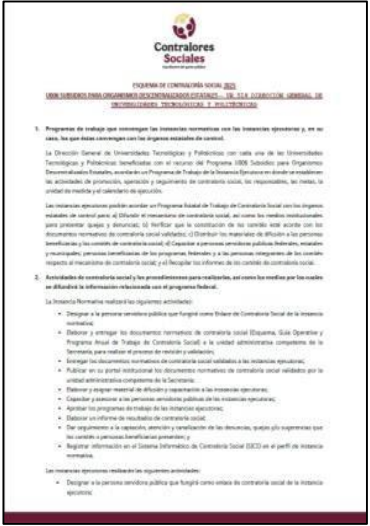
ESQUEMA DE CONTRALORÍA SOCIAL